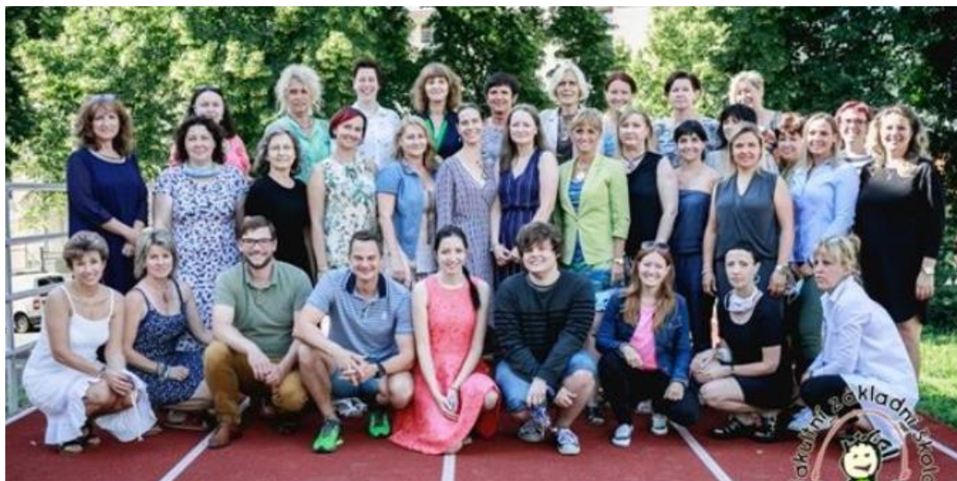
Pedagogický sbor 2020