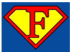
logo školního parlamentu